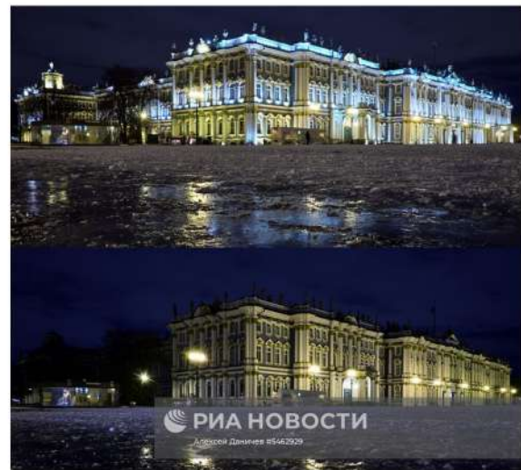
Здание Государственного Эрмитажа в Санкт-Петербурге с подсветкой и во время её отключения в рамках экологической акции «Час Земли» 2018г.

Сегодня в день Земли во многих странах проходят субботники, в том числе связанные с посадкой деревьев, очисткой водоемов. Одной из самых известных акций является «Час Земли», когда люди на один час выключают свет, чтобы привлечь внимание к проблеме энергопотребления. Россия начала участвовать в этой акции в 2009 году, и в это время в темноту погружаются даже известные здания.