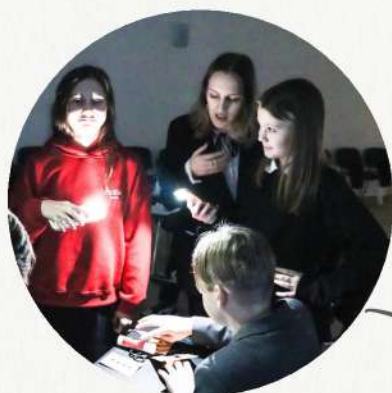
«Путешествие во времени» в 5-7 классах

Кроме того, интересным и необычным форматом стала ролевая игра « Путешествие во времени ». 5-7 классы погружались в период Средневековья, 8-9 классы – в Дворцовые перевороты, а 10-11 классы путешествовали в XX веке. У всех классов была одна цель - наладить машину времени, решить исторические задачки. Каждый лицеист имел определенную роль (например, археолог, летописец, картограф, журналист и другие). Помимо этого, в команде была роль предателя, который должен был всех запутать и не позволить собрать код в виде исторической картины. В игре было много занимательных фактов о разных эпохах. Надеемся, что для лицеистов, это был интересный взгляд на урок истории, какой он может быть и как весело можно учиться, например, многим игра напомнила „Мафию“.