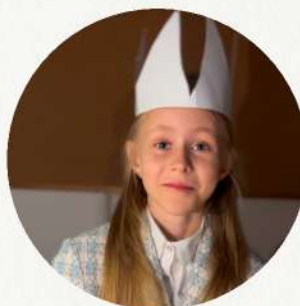
Президент Иванова Валерия