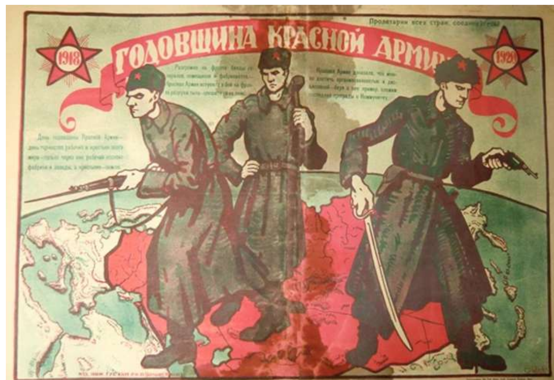
Плакат, посвящённый годовщине красной армии. Журнал, основанный Максимом Горьким, «Северное сияние»

23 февраля в России отмечают День Защитника Отечества. История праздника берет свое начало в далеком 1918 году. Этот день считается днем рождения Рабоче-Крестьянской Красной Армии (РККА). В 1922 г. он обрел свое официальное название — День Красной Армии и Флота, позднее, в 1995 году президент Борис Николаевич Ельцин утвердил другое, более обобщённое наименование «День Защитника Отечества».