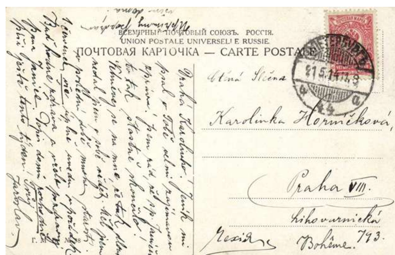
Почтовая карточка 1909-1914, Россия, Санкт-Петербург, Центральный район, СПб

Найти фото тех времен – не простая задача. Во-первых, первые фотоаппараты только начали появляться, а во-вторых, стоили фотографии очень дорого. Заплатить такие деньги одновременно могли позволить себе лишь состоятельные граждане. Поэтому обратимся к историческому виду Санкт-Петербурга с помощью почтовой карточки.