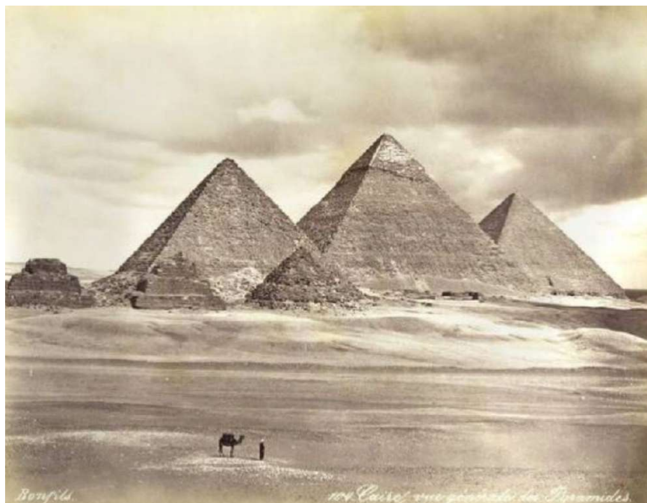
Феликс Бонфис. Пирамиды в Гизе. Египет, 1870-1890-е

Если вы хотите погрузиться в культуру Востока, на мгновение оказаться среди пирамид, почувствовать себя невольным свидетелем чайной церемонии, то вам точно стоит посетить данную экспозицию.