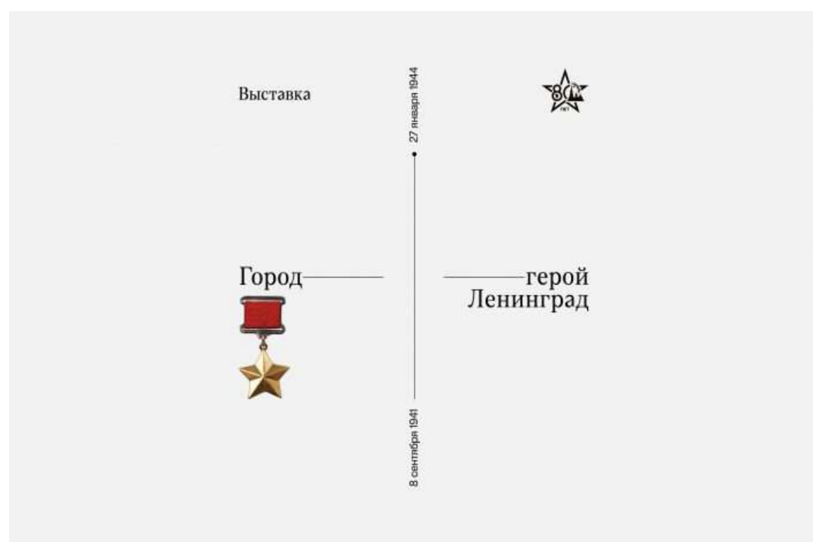
ЦВЗ «Манеж», выставочный проект «Город-герой Ленинград»

В этом масштабном выставочном проекте представлены фотографии, сделанные в конце XIX – начале XX века профессиональными фотографами и простыми туристами.