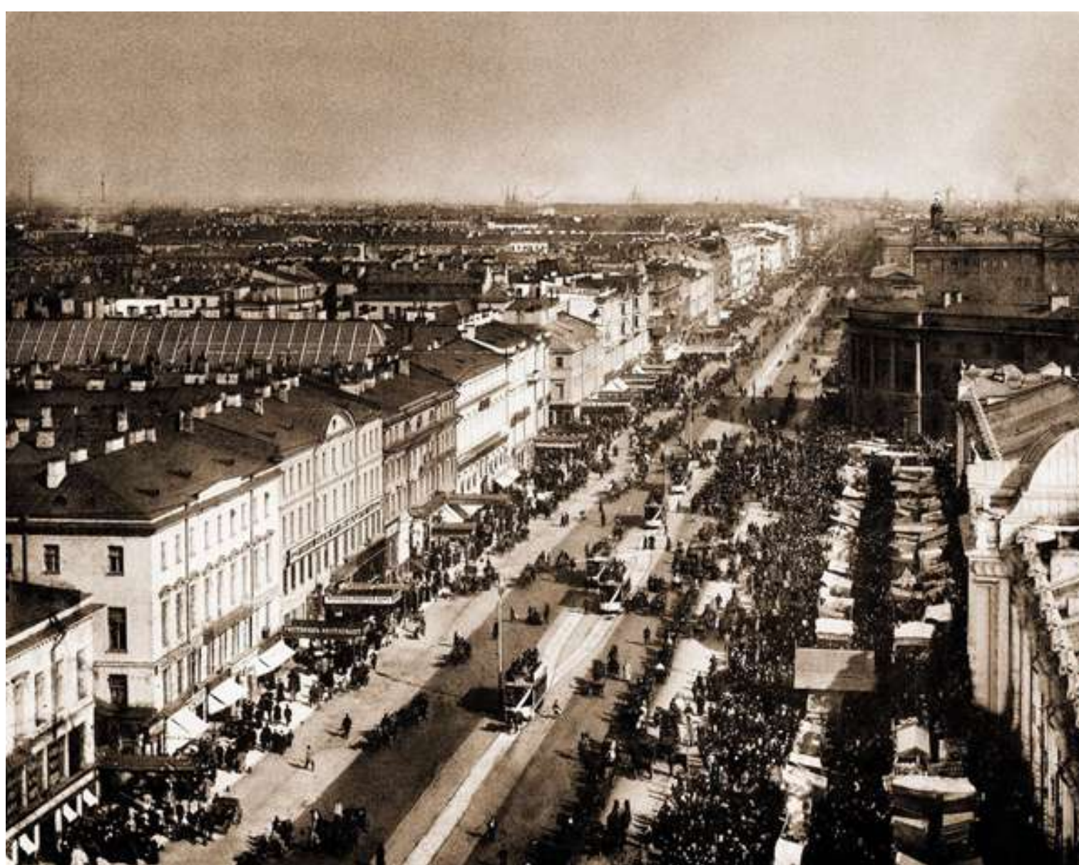
К. Булла, Невский проспект — главная улица Санкт-Петербурга. Россия. 1903 г.